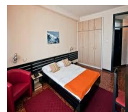
POKOJ W HOTELU